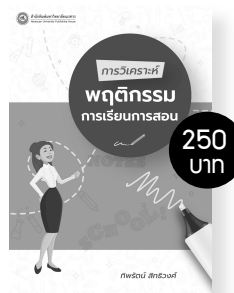
การวิเคราะห์พฤติกรรม การเรียนการสอน ผู้แต่ง: รศ. ดร.ทิพรรัตน์ สิทธิวงษ์

ทักษะในศตวรรษที่ 21 มีความซับซ้อนมากขึ้นกว่าที่จะประเมินได้ด้วยวิธีการวัดแบบดั้งเดิม ดังนั้น การประเมินการปฏิบัติ (Performance Assessment) จึงเป็นทางเลือกที่เหมาะสมกับการประเมินทักษะของผู้เรียนในยุคปัจจุบัน และเป็นทั้งวิธีการตรวจสอบการใช้ความคิดและทักษะในระดับสูงของผู้เรียนที่สอดคล้องกับการพัฒนาผู้เรียนแบบองค์รวม หนังสือเล่มนี้นำเสนอแนวคิดการประเมินการปฏิบัติ และวิธีการออกแบบการประเมินในรูปแบบต่าง ๆ โดยมีขอบข่ายของการเคลื่อนไหวทางร่างกายที่ใช้ทั้งสององและจิตใจ ซึ่งผู้เรียนทำงานร่วมกันและประยุกต์ใช้แนวคิดและทักษะในการแก้ปัญหาที่ซับซ้อน