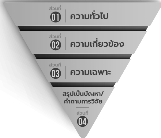
ภาพที่ 1 การเขียนความเป็นมาของปัญหา