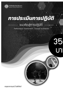
การประเมินการปฏิบัติ แนวคิดสู่การปฏิบัติ ผู้แต่ง: ผศ. ดร.ภฤชยาภาณุรณ์ โดฬพิทักษ์

“สื่อพิมพ์เพื่อการศึกษา” มิใช่เพียงแค่หนังสือหรือเอกสารทั่วไปเท่านั้น แต่มีความสำคัญอย่างยิ่งในการถ่ายทอดความรู้ไปสู่ผู้อ่านโดยผ่านการรับรู้ทางสายตา มีคำถามเกิดขึ้นมากมายเกี่ยวกับสื่อพิมพ์เพื่อการศึกษา ถึงความสำคัญของสื่อพิมพ์เพื่อการศึกษากระบวนการพิมพ์ ออกแบบสารอย่างไรให้อ่านและเข้าใจง่าย ดึงดูดความสนใจ ตัวอักษรควรใช้แบบไหนขนาดเท่าไร การจัดหน้าพิมพ์ทำอย่างไร กราฟและแผนภูมิ การเชื่อมโยงข้อความในรูปแบบของข้อความหลายมิติและสื่อหลายมิติ ช่วยส่งเสริมการรับรู้ได้อย่างไร มีกระบวนการทดสอบประสิทธิภาพสื่ออย่างไร ทุกอย่างที่เป็นคำถาม คุณหาคำตอบเหล่านั้นได้ในหนังสือเล่มนี้