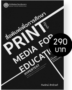
สื่อพิมพ์เพื่อการศึกษา Print media for education ผู้แต่ง: รศ. ดร.ทิพรรัตน์ สิทธิวงษ์

“สื่อพิมพ์เพื่อการศึกษา” มิใช่เพียงแค่หนังสือหรือเอกสารทั่วไปเท่านั้น แต่มีความสำคัญอย่างยิ่งในการถ่ายทอดความรู้ไปสู่ผู้อ่านโดยผ่านการรับรู้ทางสายตา มีคำถามเกิดขึ้นมากมายเกี่ยวกับสื่อพิมพ์เพื่อการศึกษา ถึงความสำคัญของสื่อพิมพ์เพื่อการศึกษากระบวนการพิมพ์ ออกแบบสารอย่างไรให้อ่านและเข้าใจง่าย ดึงดูดความสนใจ ตัวอักษรควรใช้แบบไหนขนาดเท่าไร การจัดหน้าพิมพ์ทำอย่างไร กราฟและแผนภูมิ การเชื่อมโยงข้อความในรูปแบบของข้อความหลายมิติและสื่อหลายมิติ ช่วยส่งเสริมการรับรู้ได้อย่างไร มีกระบวนการทดสอบประสิทธิภาพสื่ออย่างไร ทุกอย่างที่เป็นคำถาม คุณหาคำตอบเหล่านั้นได้ในหนังสือเล่มนี้