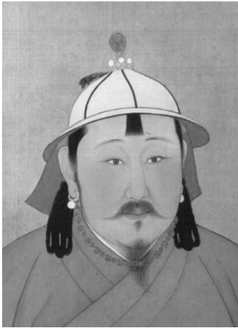
ผู้เขียนต้นฉบับ Chou Ta Kuan